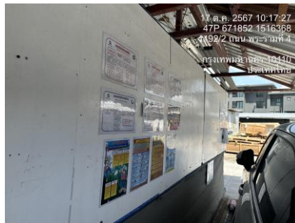
รูปที่ 30 บอร์ดประชาสัมพันธ์