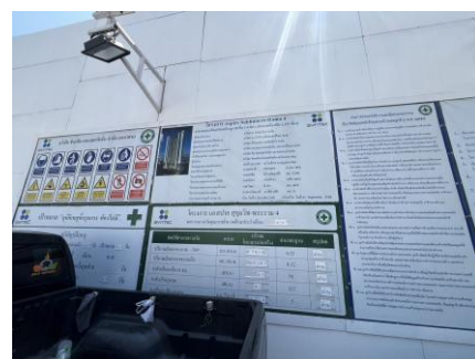
รูปที่ 12 ป้ายรายละเอียดโครงการ