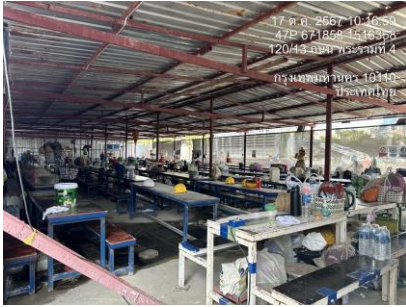
รูปที่ 26 พื้นที่รับประทานอาหารสำหรับพนักงาน (ต่อ)