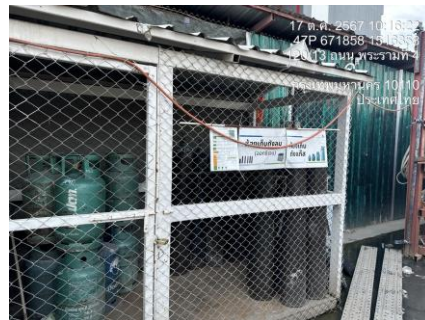
รูปที่ 29 พื้นที่เก็บวัตถุไวไฟ