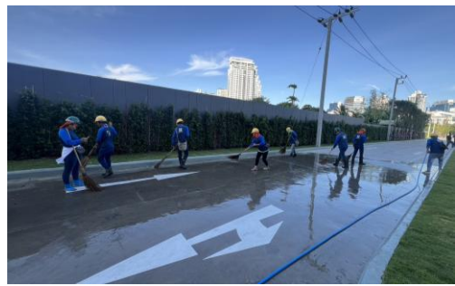
รูปที่ 10 คนงานทำความสะอาดบริเวณโครงการ