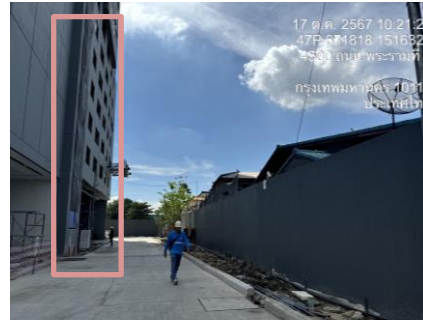
รูปที่ 9 ใบก่อสร้าง (Mesh sheet)