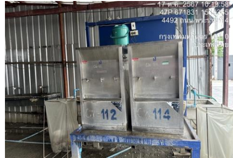
รูปที่ 27 น้ำดื่มสำหรับพนักงาน