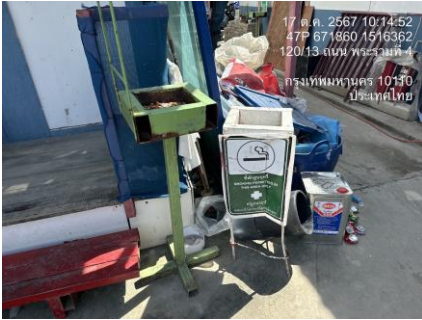
รูปที่ 28 พื้นที่สูบบุหรี่