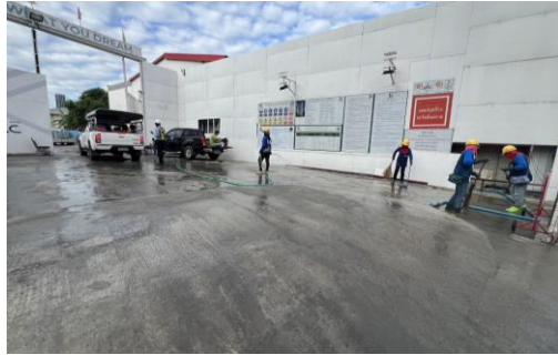
รูปที่ 8 ฉีดพรมบริเวณหน้าโครงการ